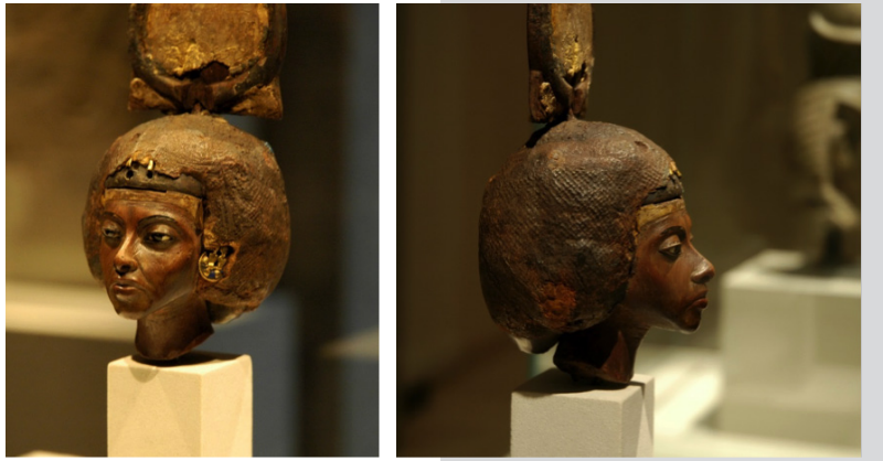
Koningin Teyje Amarna Egypte 1350 voor Christus.

Is een cursus die start bij de oudste vormen van verbeelden. U krijgt een introductie in de vroege constructieprincipes van de architectuur. We bekijken de piramides en de fascinerende beelden uit Egyptisch Amarna. Naast het oude Egypte bespreken we de bijzondere verbeeldingen uit het vroege Mesopotamië. Daarnaast is er aandacht voor de (pre)Griekse beschavingen op Kreta (Minoïsch), Cycladen (Cycladisch) en de Helleense beschavingen. (O.a. Mycene). Het zwaartepunt van deze cursus is echter weggelegd voor de Klassieke Oudheid. We volgen de ontwikkeling in de Griekse beeldhouwkunst, bespreken uitgebreid de architectuur van de tempel en bekijken de schilderkunst op vazen.